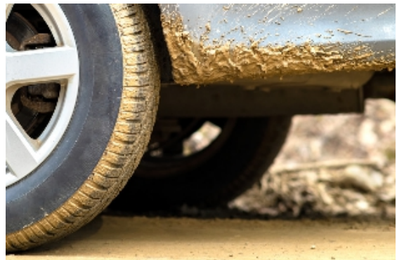
Roue avant gauche

Salissures de boues sur la carrosserie et sur la bande de roulement des pneus.